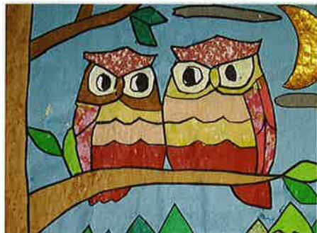
縁起が良い福来朗