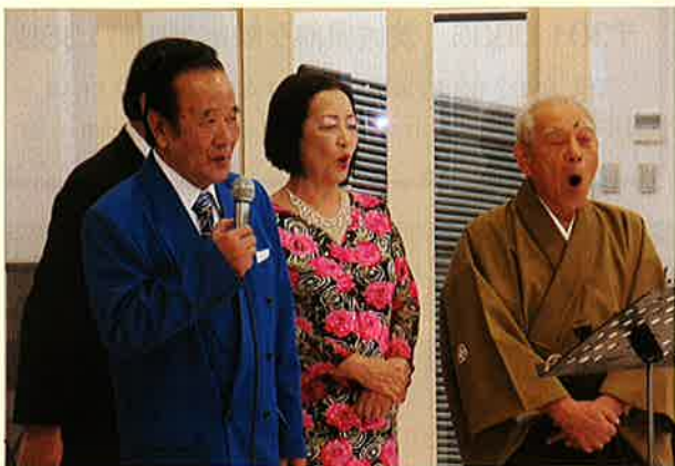
「あざみの会様」 歌とダンス楽しかった♪