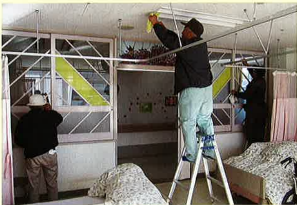
家族会による年末大掃除 きれいになりました。ありがとうございます♪