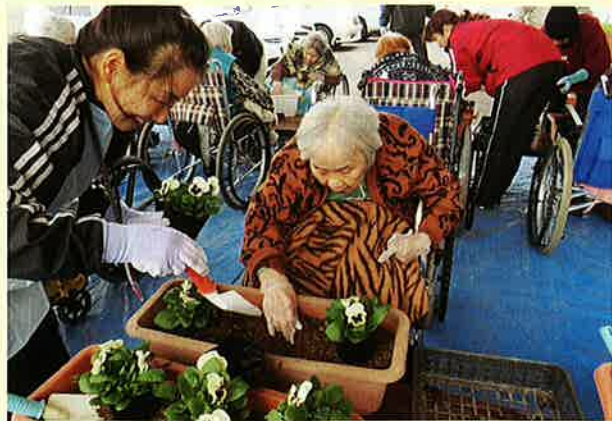
「長戸コミュニティセンター様」 地域交流の花の植え替え