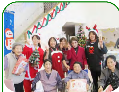
プレゼントありがとう