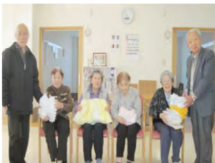
毎年有り難うございます

市立城南中学校の生徒さんたちよりならせもちを頂きました。 昔ながらの風習を大事にしたいという思いで毎年行っているそうです。