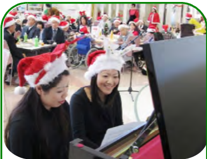
見事なピアノの演奏です