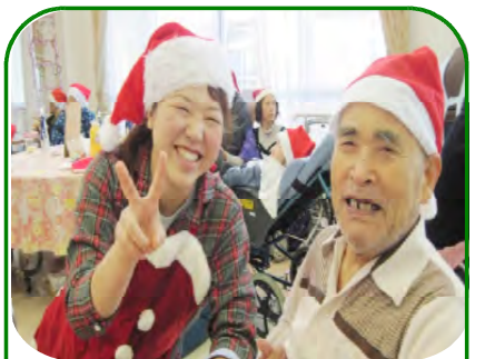
笑顔溢れる一日でした