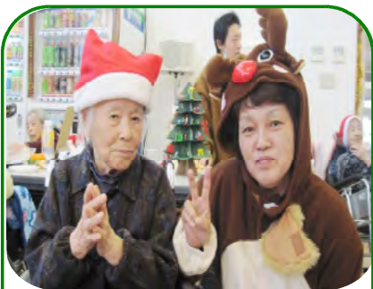
トナカイとハイチーズ！