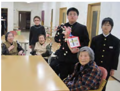
玄関に飾らせて頂きました

市立城南中学校の生徒さんたちよりならせもちを頂きました。 昔ながらの風習を大事にしたいという思いで毎年行っているそうです。