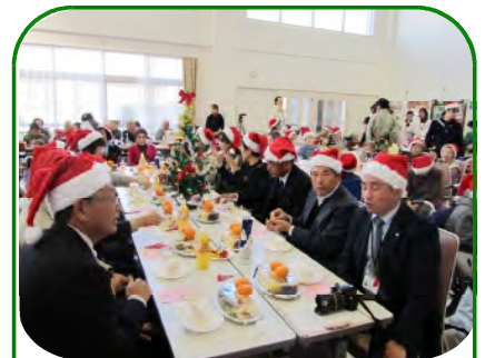
地域の皆様も一緒に