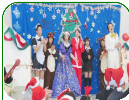
皆でメリークリスマス！