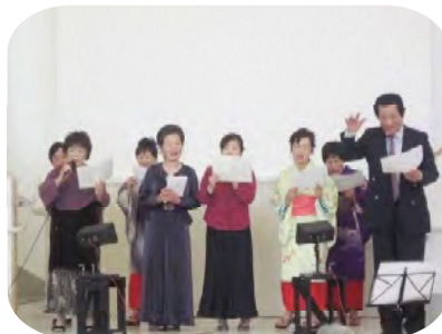
おなじみの東龍会様による 懐かしのメロディを鑑賞。 次の好演お待ちしております。