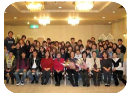
職員の歓送迎会を兼ねた 忘年会を実施しました。 大変盛り上がりました。