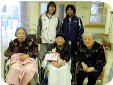
城南中学校の生徒さんより ならせもちを頂きました。 ありがとうございました。