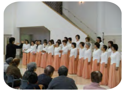
龍ヶ崎女声合唱団様による 華やかなコーラスの歌声に うっとりされていました。