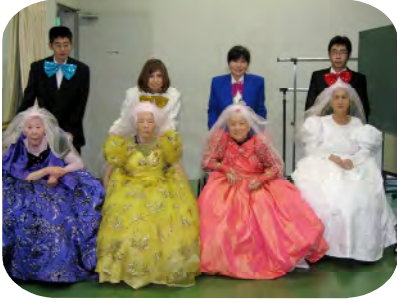
龍ヶ崎小唄保存会様より 新年の集いにお招き頂き 晴れの舞台を演じました。