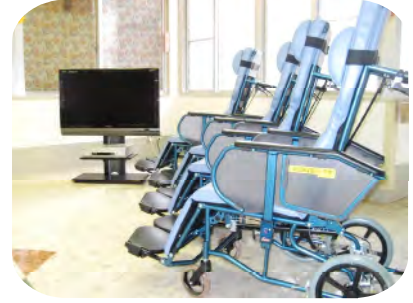
家族会の皆様より、地デジ 対応テレビと車椅子4台を 寄贈頂き、感謝致します。