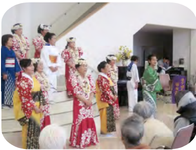
龍ヶ崎小唄保存会様による 日本舞踊とフラダンスの ステージを鑑賞しました。