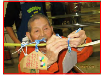
今年の願いは？健康第一！