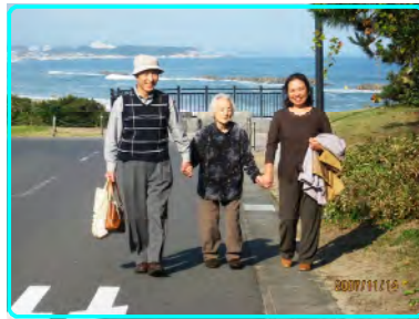
親子でのんびり旅行気分