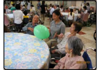
レクリエーション活動

A D L (日常生活活動) Q O L (生活の質) の向上のために、リハビリテーション・クラブ活動レクリエーションを通し、心身共に豊かな毎日を送っていただけるように計画を立てています。