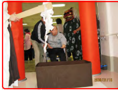
竜成園神社にお参りだ