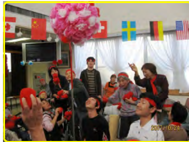
頑張り赤組！負けるな白組！