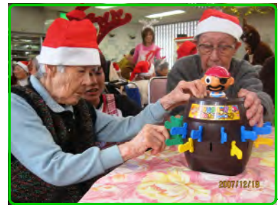
黒ひげ危機一髪！ドキドキ