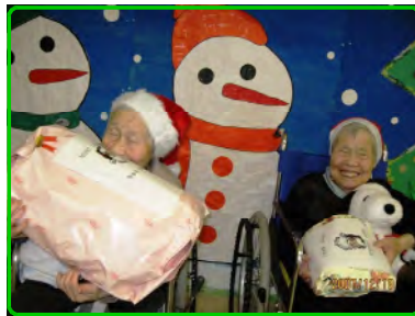
サンタさんプレゼントありがとう