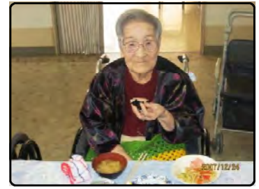
グループ食事の様子

ご利用者の毎日の生活において、大きな楽しみの一つである「食」の充実のため様々な取り組みを行い、明るい雰囲気のもとで美味しく、健康的で安全なお食事をしていただくよう援助します。