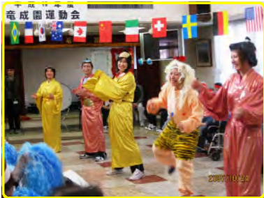
職員も・・・体張ってます！