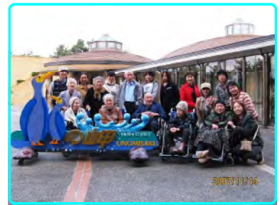
バスハイクで鶴の岬へ