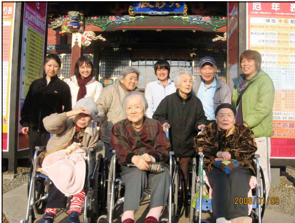
あけましておめでとうございます 今年も良い年になりますように ~ 2008年1月9日 大杉神社へ初詣 ~