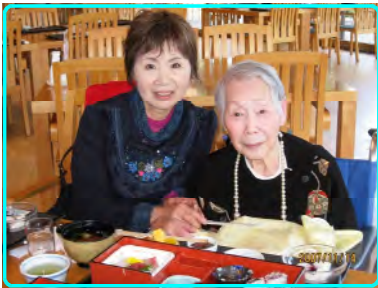
おいしいご飯に大満足です