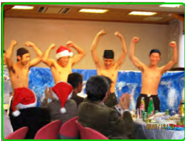
ウォーターボーズ参上 ワオー！