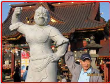
像のようにたくましく