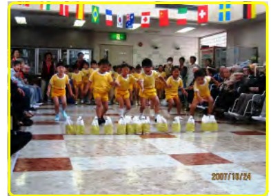
よーいドンで狙うはお菓子？