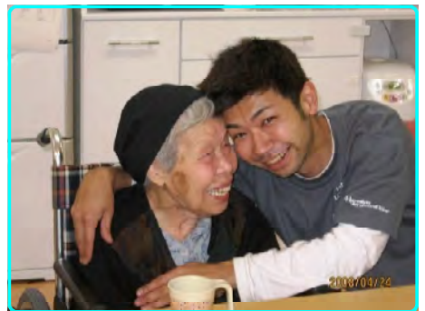
可愛がって頂いてます