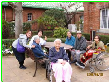
心地よい春のひとつき