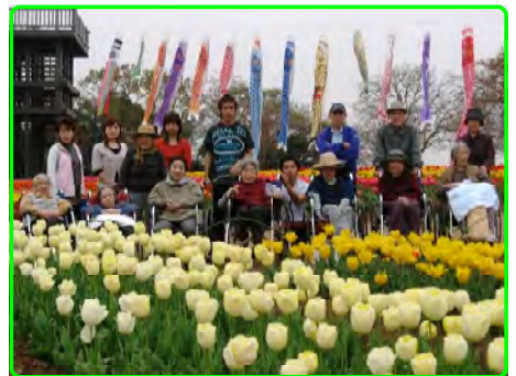
色とりどりのチューリップ