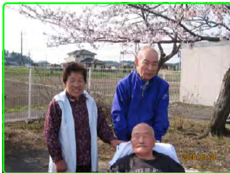
満開の桜の木の下で