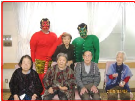
鬼退治後の記念撮影？

ご利用者の皆さんの、とっておきの写真を集めました！ 今号では、節分・雛祭り・お花見のスナップを中心に掲載します