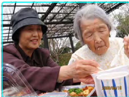
お外でのご弁当にご満悦