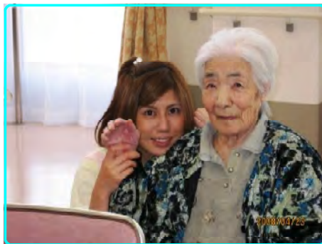
実の孫のように仲良く