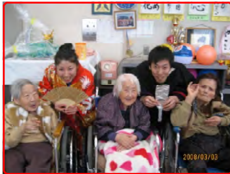
美男美女のお内裏様と