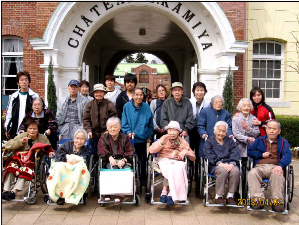
新しい仲間と一緒に和気あいあいとお出掛けしました ~ 2008年4月2日 シャトーカミヤへお花見 ~