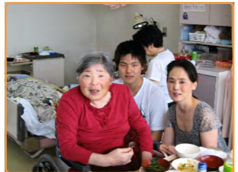
家族会 でも、私の一番は家族です