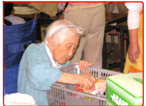
夏物衣料販売会 ご利用者より楽しんでます？ あれもこれも沢山欲しい！