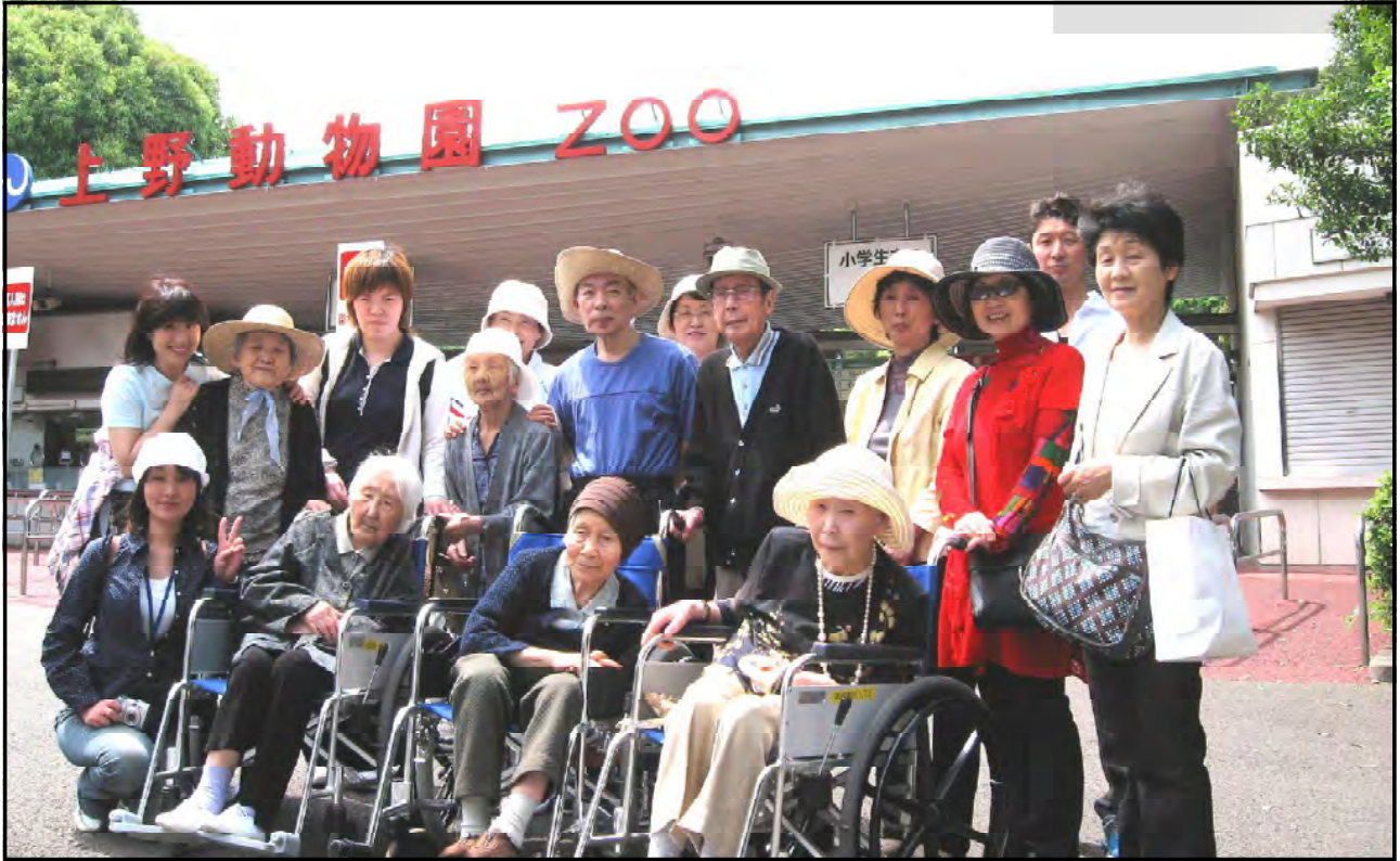
青空の下「ハイチーズ！」みんなで記念写真 ~ 2007年5月16日 上野動物園バスハイク ~