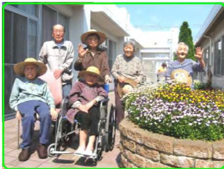
中庭で日光浴 あっち向いてるのだ～れ？