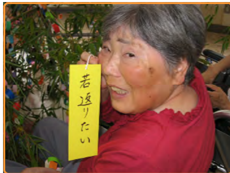
七夕会 女の夢・・・若返り！！