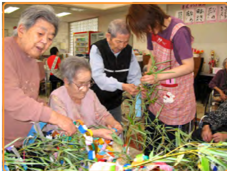
七夕会 みなさんの願いは何か？