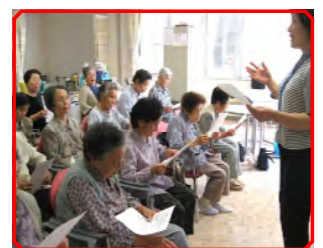
梁取指導員による講義