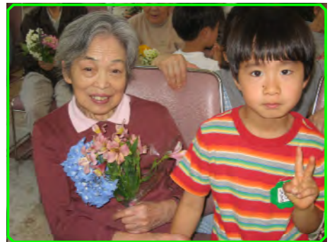
龍ヶ崎幼稚園慰問 やっぱり子供は大好きよ