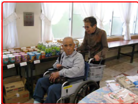
夏物衣料販売会 やっぱり買い物は奥さんと！