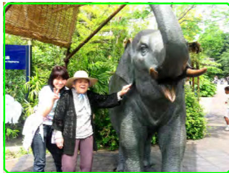
上野動物園 おっきな象だゾウ