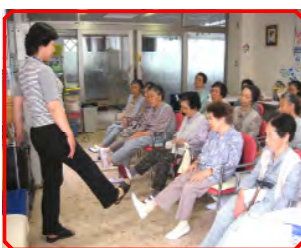
生活動作訓練の様子

「体を動かすことが健康につながる」疎かになりがちですが、これからは努めて体を動かして、自分にあった運動をしながら一日一日を楽しく健康な人生を送りたいと思います。